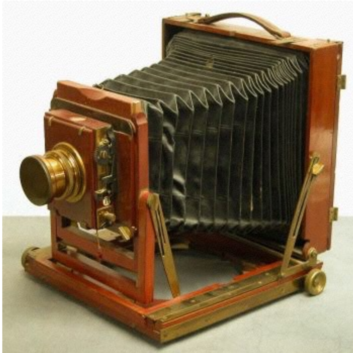
FOTOAPPARAT um 1890, zusammenklappbar mit ausziehbarem Balg